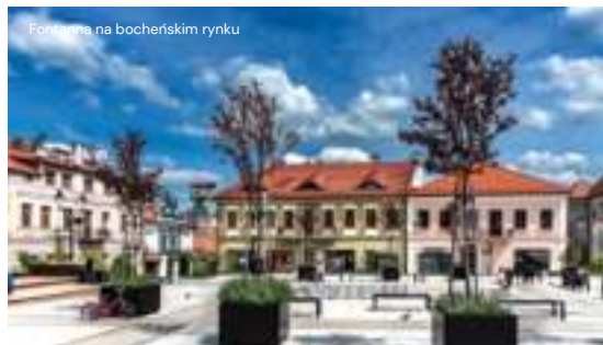
Fontanna na bocheńskim rynku

By popatrzeć na miasto z góry i objąć wzrokiem sporą jego część, udajmy się z Rynku na spacer w stronę wzgórza Uzbornia, na którym znajduje się wieża widokowa. Podczas spaceru przyda się zapewne plan miasta zamieszczony na 12 i 13 stronie niniejszej publikacji. Spacer na Uzbornie najlepiej rozpocząć ulicą Sądecką. Możemy przez kilkadziesiąt metrów nie zbacać z tej ulicy, kontynuując dość forsowną wspinaczkę, ale możemy też po niespełna 200 metrach od Rynku skrócić w ulicę Sienkiewicza lub Węgierską.