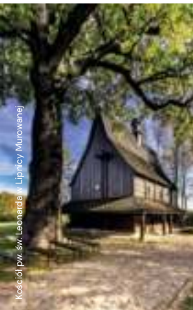
Kościół pw. św. Leonarda - Lipnica Murowana

Murowanej – piękny, średniowieczny Rynek oraz wpisany na listę UNESCO kościół pw. św. Leonarda. W Lipnicy Górnej (nieopodal gospody) znajduje się słynny pomnik przyrody nieożywionej „Kamienie Brodzińskiego”. Warta polecenia jest też wycieczka do Rozdziała koło Żegociny. Przy drodze nr 965 znajduje się tam niewielki parking na Przełęczy Widoma. Można stamtąd podziwiać piękną panoramę. Przez przełęcz prowadzi rozpoczynający się w Bochni niebieski szlak PTTK. Prowadzi on stamtąd na najwyższy szczyt w powiecie bocheńskim – górę Kamionna (801 m n.p.m.), na stoku której działa stacja narciarska.