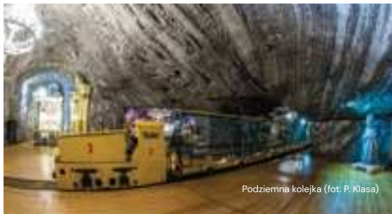
Podziemna kolejka

Specjalnie dla rodzin z dziećmi kopalnia przygotowała wariant zwiedzania trasy turystycznej: Rodzinne zwiedzanie Królestwa Skarbnika . Wybierając ten wariant wycieczki mali podróżnicy i ich opiekunowie przeniosą się do niezwykłej krainy Skarbnika – opiekuna solnych podziemi. Pełna niespodzianek wyprawa solnymi korytarzami prowadzi młodych odkrywców wprost do spotkania z dobrym duchem kopalni.