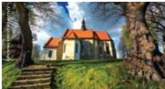
Zabytkowy kościół w Łączycy

Cały szlak może być zbyt długi do pieszego przebycia, ale za cel wyprawy możemy obrać np. XIV-wieczny kościół pw. Narodzenia NMP w Łączycy (ok. 5 km od centrum Bochni). Świątynia usytuowana jest na wzgórzu, z którego roztaczają się malownicze panoramy.