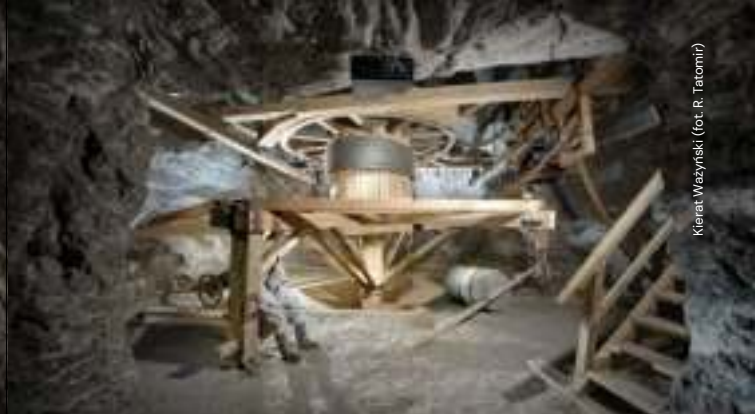
Kierat Ważyński