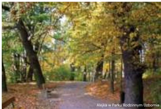
Alejka w Parku Rodzinnym Uzbornia