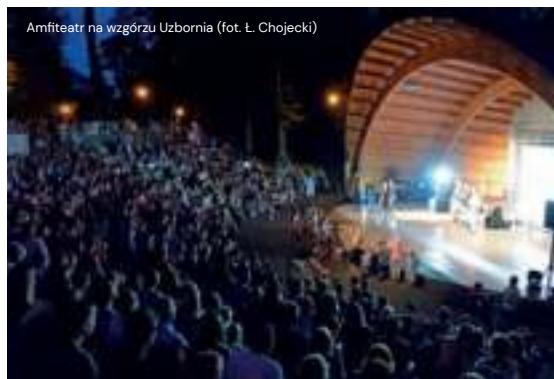
Amfiteatr na wzgórzu Uzbornia