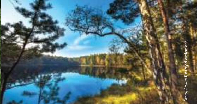
Czarny Staw w Puszczu Niepołomickiej

Z Rynku ulicami: Szewską, Regis, Konstytucji 3-go Maja, Karosek, Wodociągową i Majora Bacy do mostu wiszącego na Rabie, a stamtąd przez Damienice fragmentem niebieskiego szlaku rowerowego Salina Cracoviensis do Puszczy Nie-