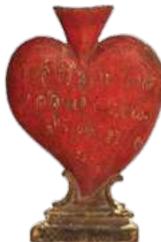
Obesłanie cechu szewców w Bochni z 1790 r.

Miłośników sztuki zainteresuje z pewnością galeria malarstwa polskiego XIX i XX w. Interesująca jest ekspozycja kultur pozaeuropejskich (Afryka, Azja, Ameryka Południowa, Ameryka Północna, Oceania). Muzeum posiada ponadto cenne zbiory rękopiśmienne, m.in. królewskie dokumenty pergaminowe. Pokazna jest też kolekcja pamiątek historycznych związanych z Bochnią i jej okolicą. Na uwagę zasługuje zbiór ok. 200 świątków, ciekawa grafika ludowa oraz ceramika.