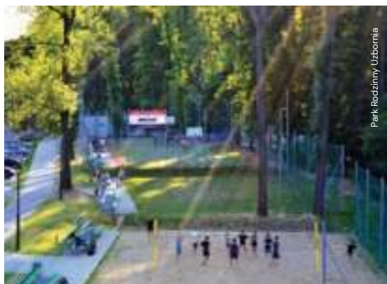
Park Rodzinny Uzbornia

Po kilkusetmetrowym spacerze pod górę dotrzemy do ulic Uzbornia i Widok, a tam po prawej stronie ujrzymy zalesioną część wzgórza. Można tam odpocząć po męczącym spacerze, obejrzeć Bochnię z tarasu widokowego, wypić kawę w restauracji, by następnie odnowionymi alejkami zejść aż do ulicy Parkowej, przy której znajduje się miejski stadion. Ulica Parkowa wychodzi wprost na główną część miasta – ul. Kazimierza Wielkiego. Stamtąd do Rynku nie można już nie trafić. Zmierzając w jego kierunku minimy m.in. kilka zabytkowych kamienic oraz park na Placu Turka.