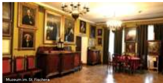
Muzeum im. St. Fischera

Przedmiotem działalności muzeum jest zasadniczo ziemia bocheńska, ale wiele zabytków i dzieł sztuki wykracza poza ten zakres.